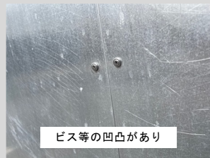
ビス等の凹凸があり